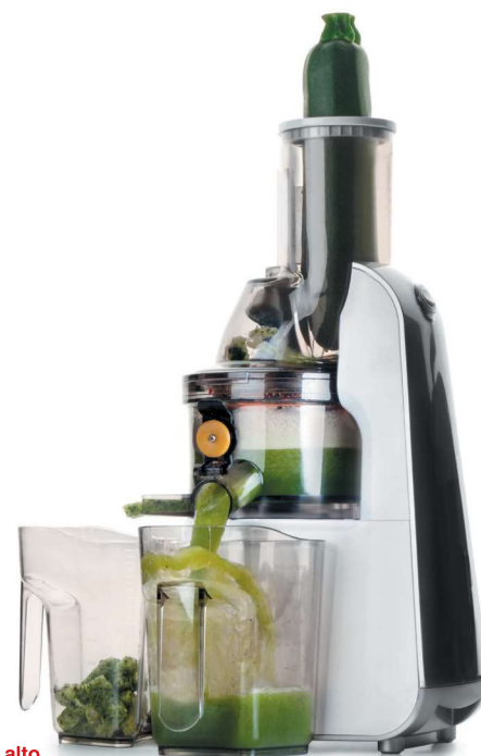
Exprimidor lento alto Presse-agrumes lent haute Langsamer Fruchtsafer, Hoch High slow juicer Espremedor lento alto