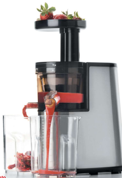
Exprimidor lento Presse-agrumes lent Langsamer Fruchtsafter Slow juicer Espremedor lento