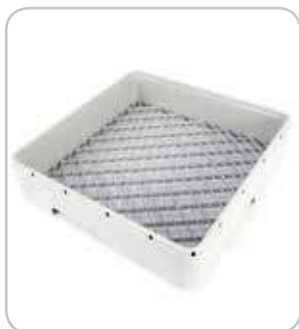
2315340 Cesta base 450x450x110mm PVP 49€