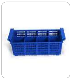
5300125 C-1371 Cestillo cubiertos C-1371 430x210x150mm PVP 14€