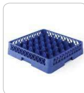
5300194 C-9 Cesta base 49 div. Ø64 h:100mm PVP 37€