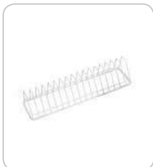
2302058 Suplemento platillos 310x95 PVP 6€

Diferentes modelos de cestillos de cubiertos y suplementos de platillos para lavavasos y lavavajillas.