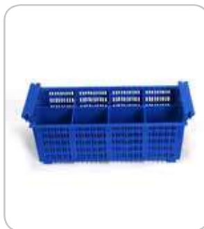
5300125 C-1371 Cestillo cubiertos C-1371 430x210x150mm PVP 14€