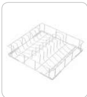
2315341 Cesta platos 450x450x110mm PVP 49€