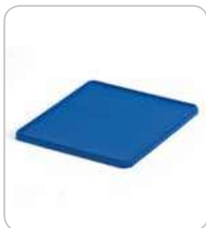
5300152 C-13 Tapa cestas 500x500 ciega PVP 18€