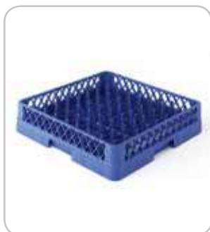
5300112 C-3 Cesta platos 500x500 h:100mm PVP 22€