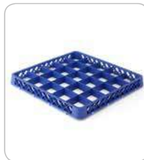
5300220 C-E Extensión cesta 49 div. h:45mm PVP 14€