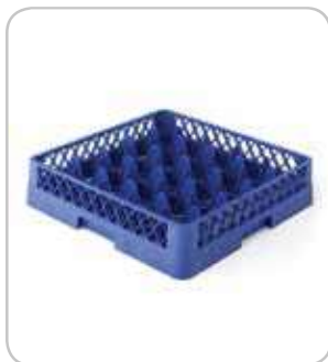
5300159 C-6 Cesta base 25 div. Ø90 h:100mm PVP 31€