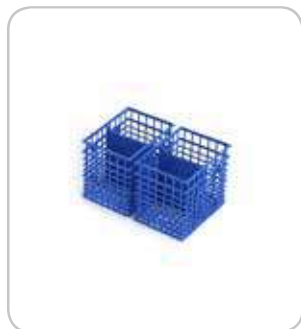
2302617 Cestillo pequeño doble cubier- tos PVP 7€