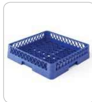
5300130 C-2 Cesta cubiertos 500x500 h:100mm PVP 22€