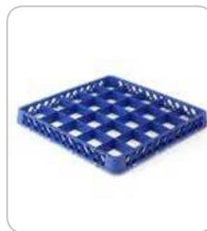
5300220 C-E Extensión cesta 49 div. h:45mm PVP 14€