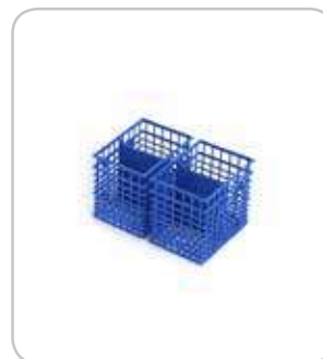
2302617 Cestillo pequeño doble cubiertos PVP 7€