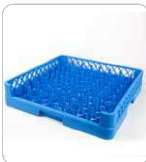
5300120 C-30 Cesta bandejas 500x500 h:100mm PVP 30€