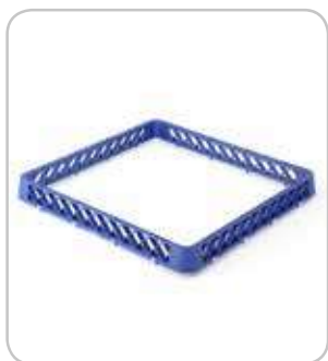
5300200 C-A Extensión abierta cestas h:45mm PVP 9€