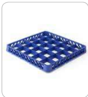
5300205 C-B Extensión cestas 25 div. h:45mm PVP 12€