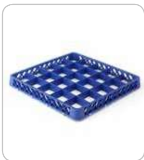
5300205 C-B Extensión cestas 25 div. h:45mm PVP 12€