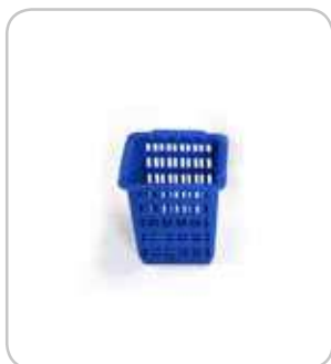
5300135 C-1370 Cubilete cubiertos 105x105x125 PVP 5€