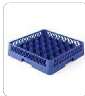
5300194 C-9 Cesta base 49 div. Ø64 h:100mm PVP 37€