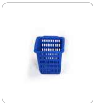
5300135 C-1370 Cubilete cubiertos 105x105x125 PVP 5€