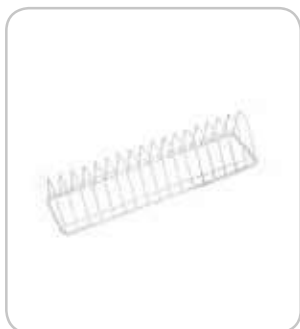
2305488 Suplemento platos 350x95 PVP 7€