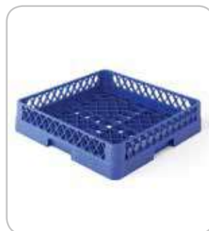
5300130 C-2 Cesta cubiertos 500x500 h:100mm PVP 22€