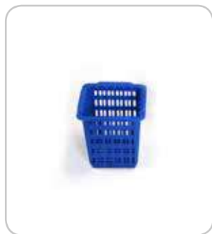
5300135 C-1370 Cubilete cubiertos 105x105x125 PVP 5€