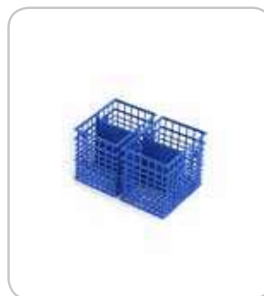
2302617 Cestillo pequeño doble cubier- tos PVP 7€