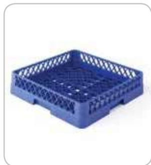
5300105 C-1 Cesta base 500x500 h:100mm PVP 22€