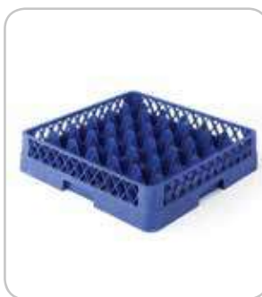
5300184 C-7 Cesta base 36 div. Ø75 h:100mm PVP 32€