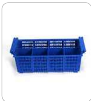
5300125 C-1371 Cestillo cubiertos C-1371 430x210x150mm PVP 14€