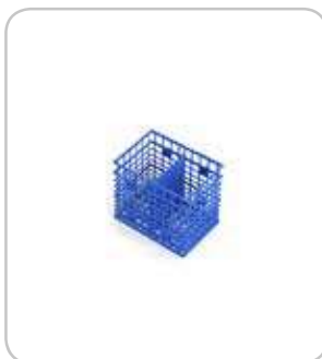
2302615 Cestillo pequeño cubiertos PVP 3€