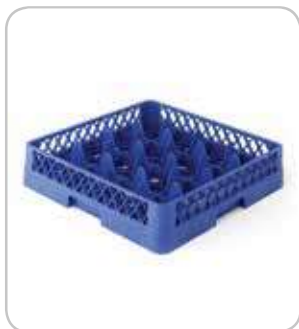
5300174 C-8 Cesta base 16 div. Ø113 h:100mm PVP 30€