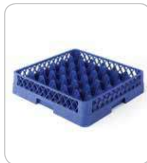
5300194 C-9 Cesta base 49 div. Ø64 h:100mm PVP 37€