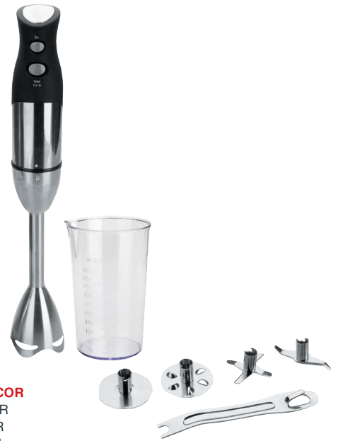
Batidora LACOR Mixeur LACOR Mixer, LACOR LACOR blender Batedeira LACOR