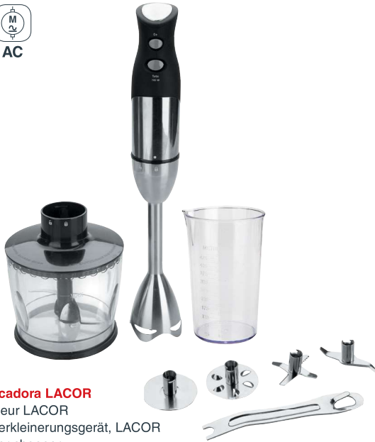
Batidora Picadora LACOR Mixeur hacheur LACOR Rühr- und Zerkleinerungsgerät, LACOR Lacor blender chopper Batedeira picadora Lacor