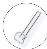
Pinza bandeja Tray tong