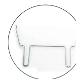
Mango pincho mariposa Handle of butterfly skewer