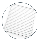
Parrilla Wire rack